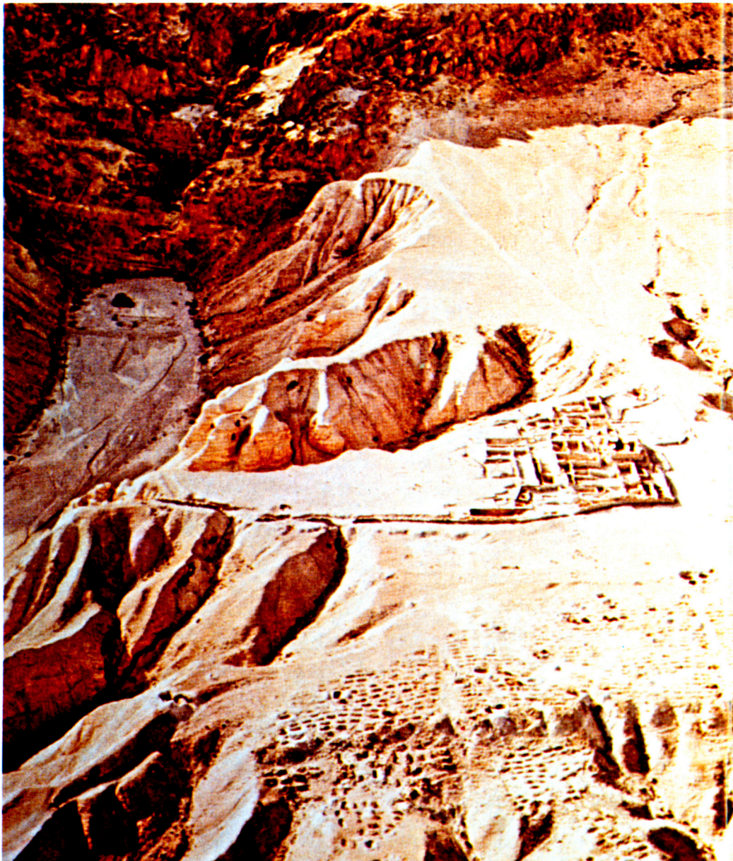
這是考古學家於1947年在谷木蘭發現團體聚居的地方。圖中的前方為墳場。

厄色尼人脫離了官方的猶太教，而在曠野中渡著一種修道院式的生活，這組織是由會眾的主席所管治；他是法律的裁判人，也是全團的監督人，並且在戰事中，他也是軍事的統帥。